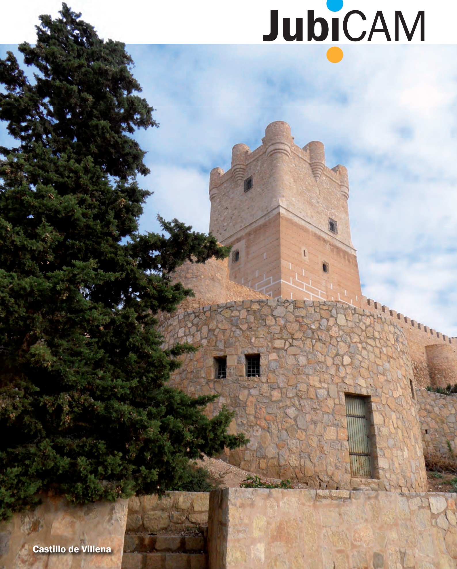
Castillo de Villena