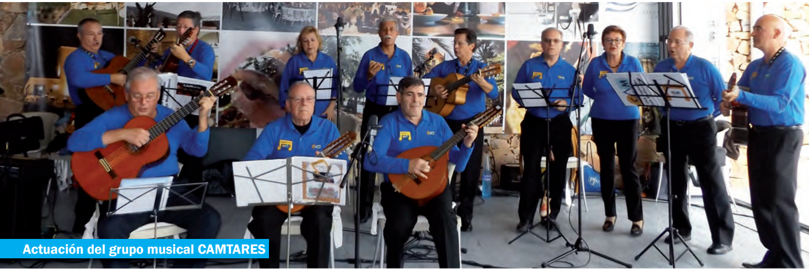
Actuación del grupo musical CAMTARES