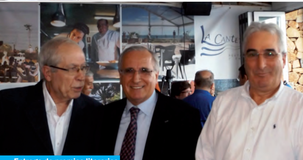
Entrega de premios literarios