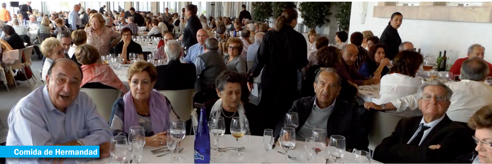
Comida de Hermandad